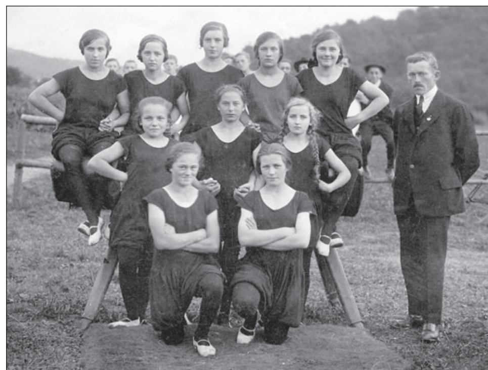
1926 gab's die erste Mädchenriege im Schnaiter Verein.